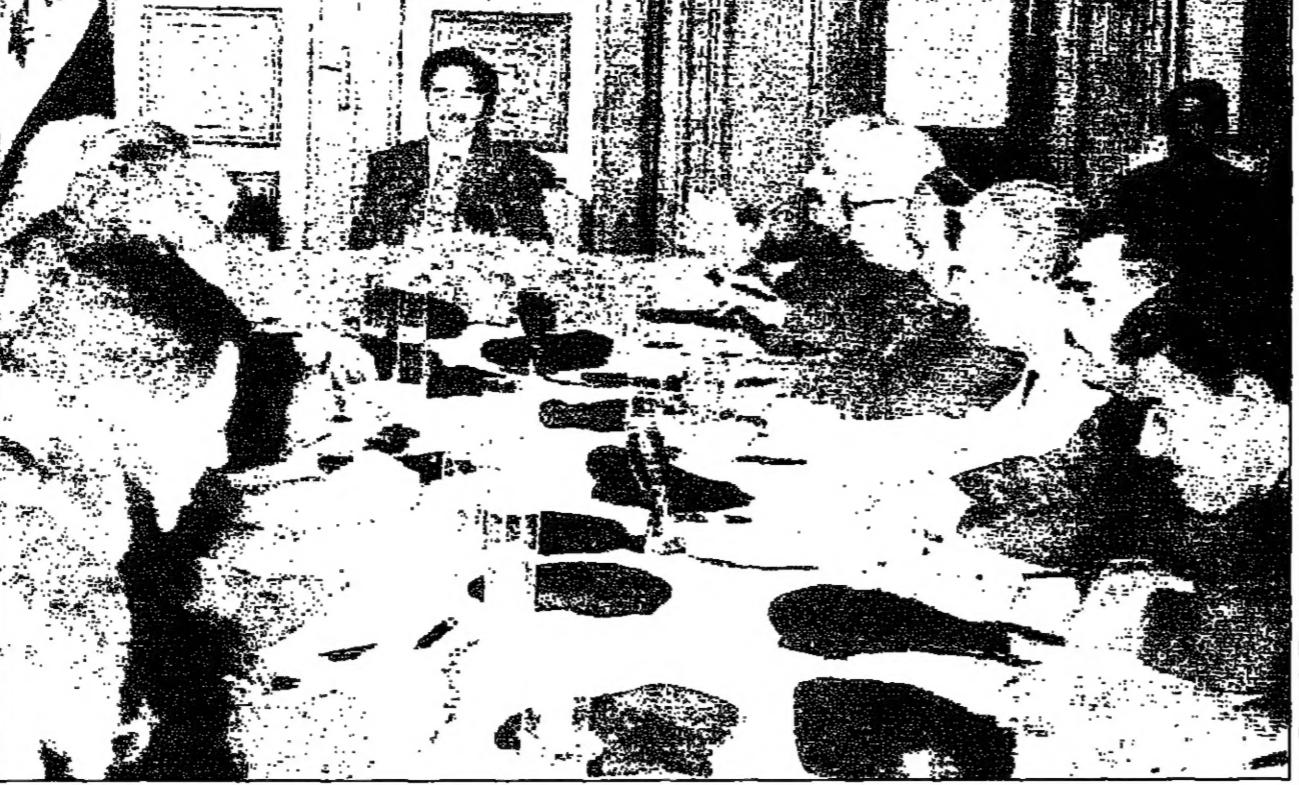
الرئيس العراقي صدام حسين لدى اجتماعه بالقيادة العراقية أمس لاتخاذ موقف بشأن وقف التعاون مع فريق التحقيق الدولي